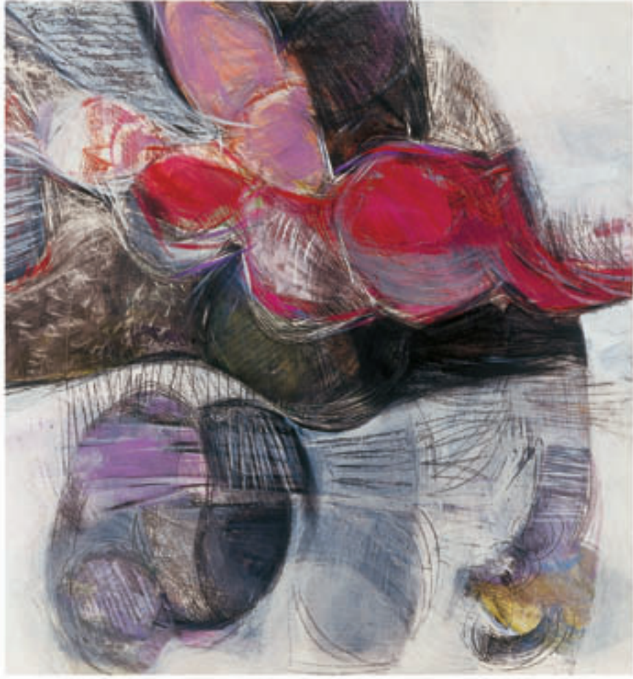
40 x 40 cm Mix media on plywood