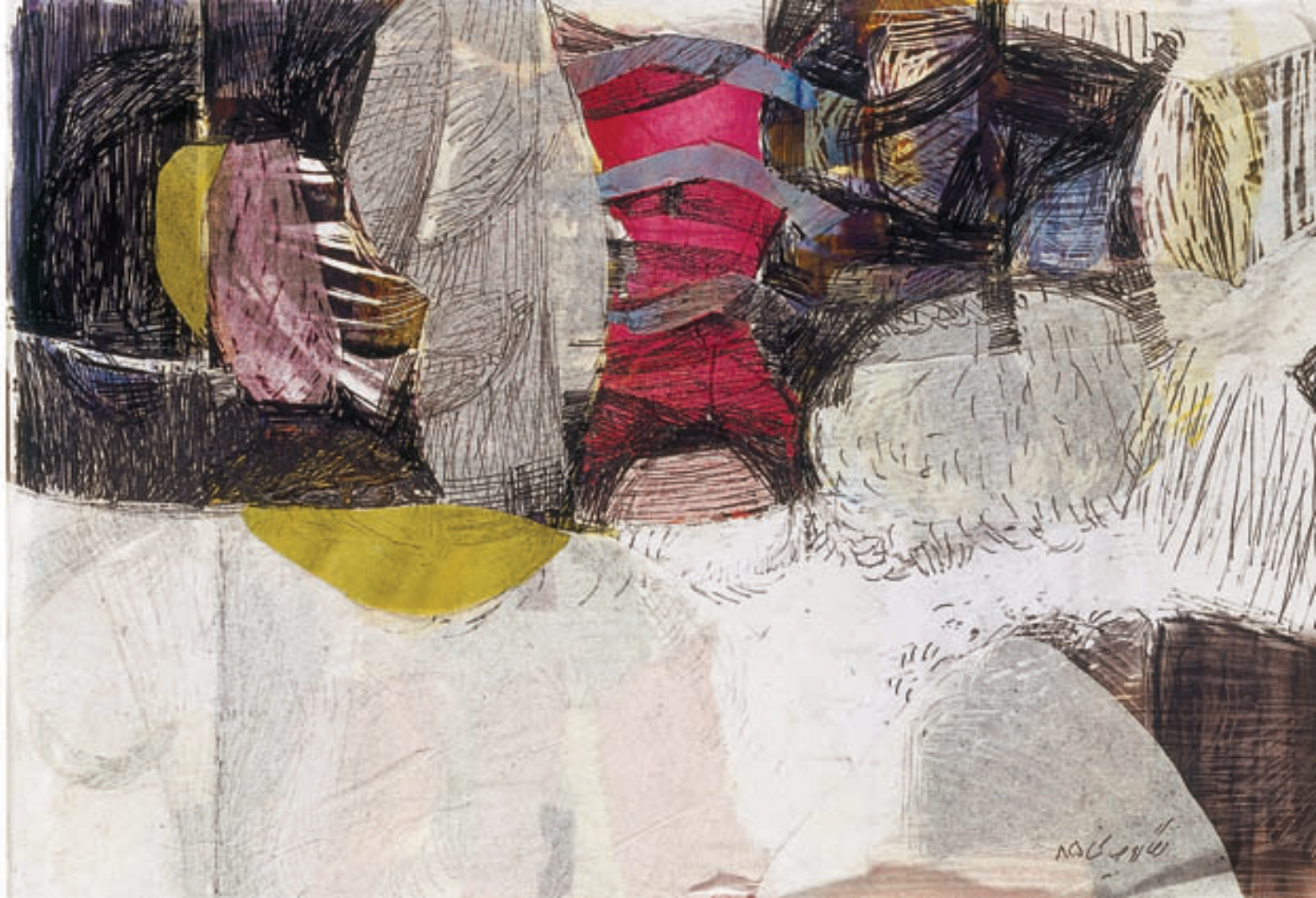
Mix media on photo paper & collage 21 x 30 cm