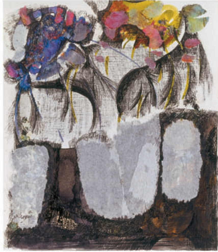
Mix media on cardboard & collage 29 x 25 cm