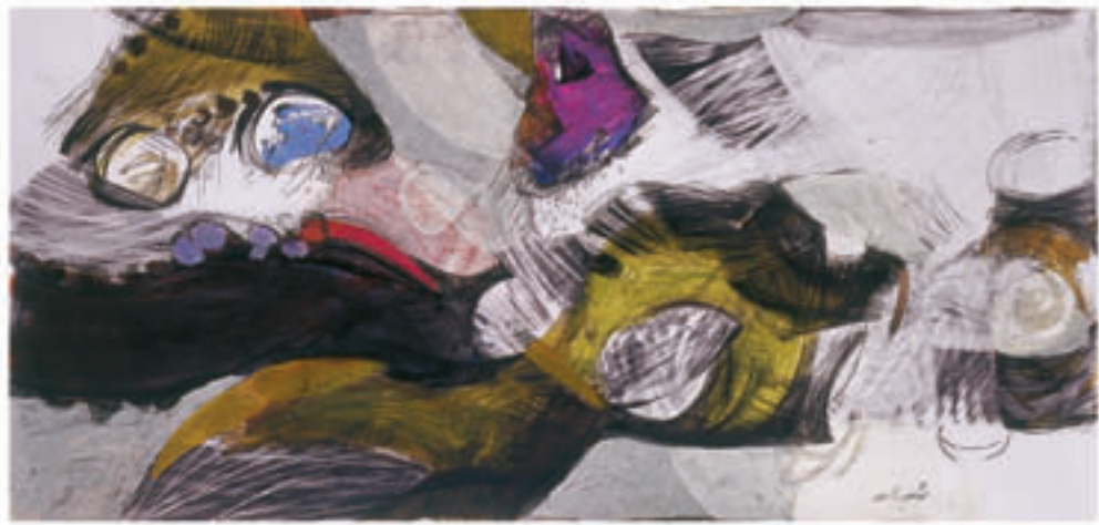
Mix media on cardboard & colage 33 x 69 cm