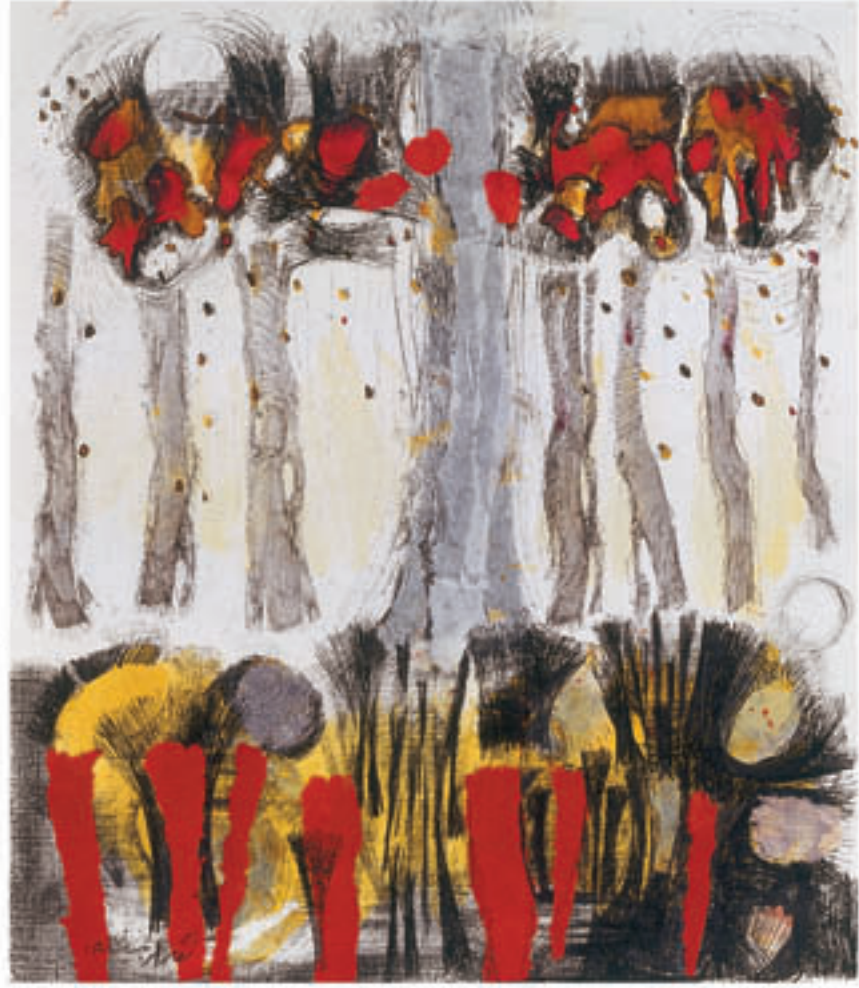
29 x 25 cm Mix media on cardboard & collage