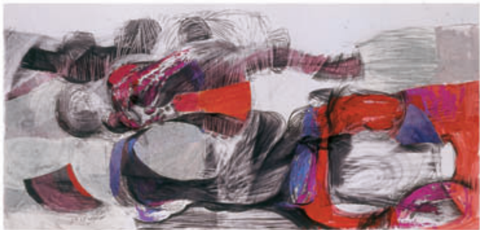
Mix media on cardboard & colage 33 x 69 cm