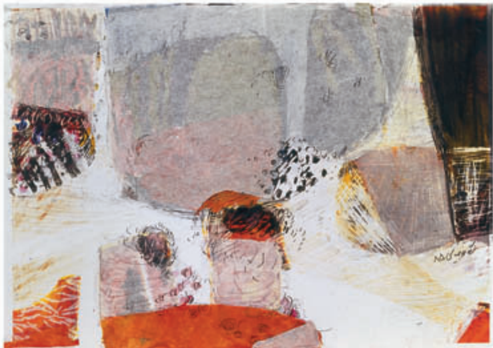
Mix media on photo paper & colage 21 x 30 cm