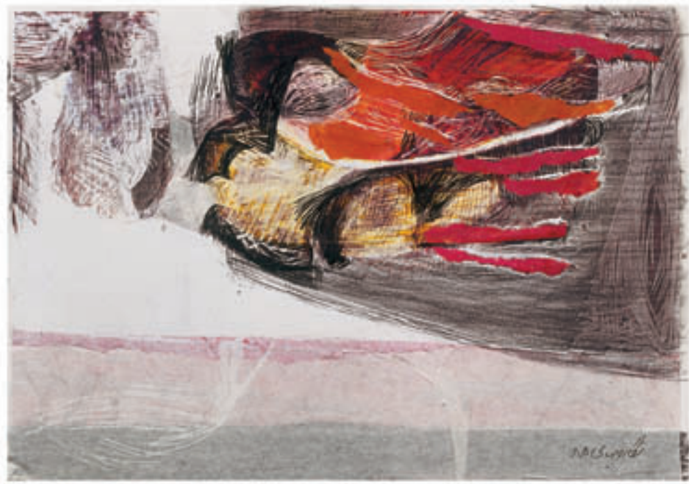
Mix media on photo paper & colage 21 x 30 cm