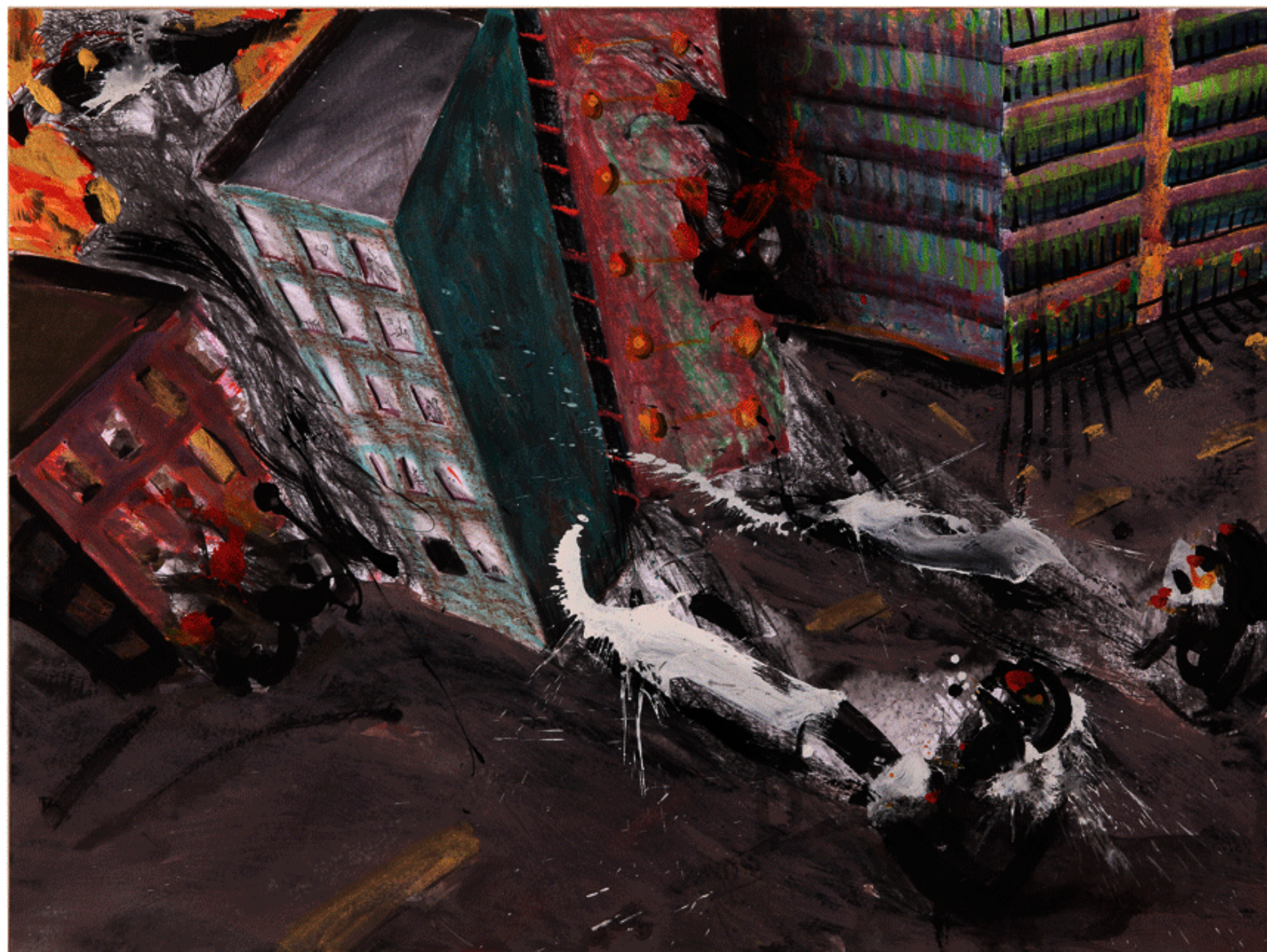
شماره ۱ از مجموعه ی شمایل های من، ترکیب مواد روی مقوا، ۹۰×۱۲۰ سانتی متر، ۱۳۸۷ No. 1 from the My Icons series, mixed media on cardboard, 90x120 cm, 2008