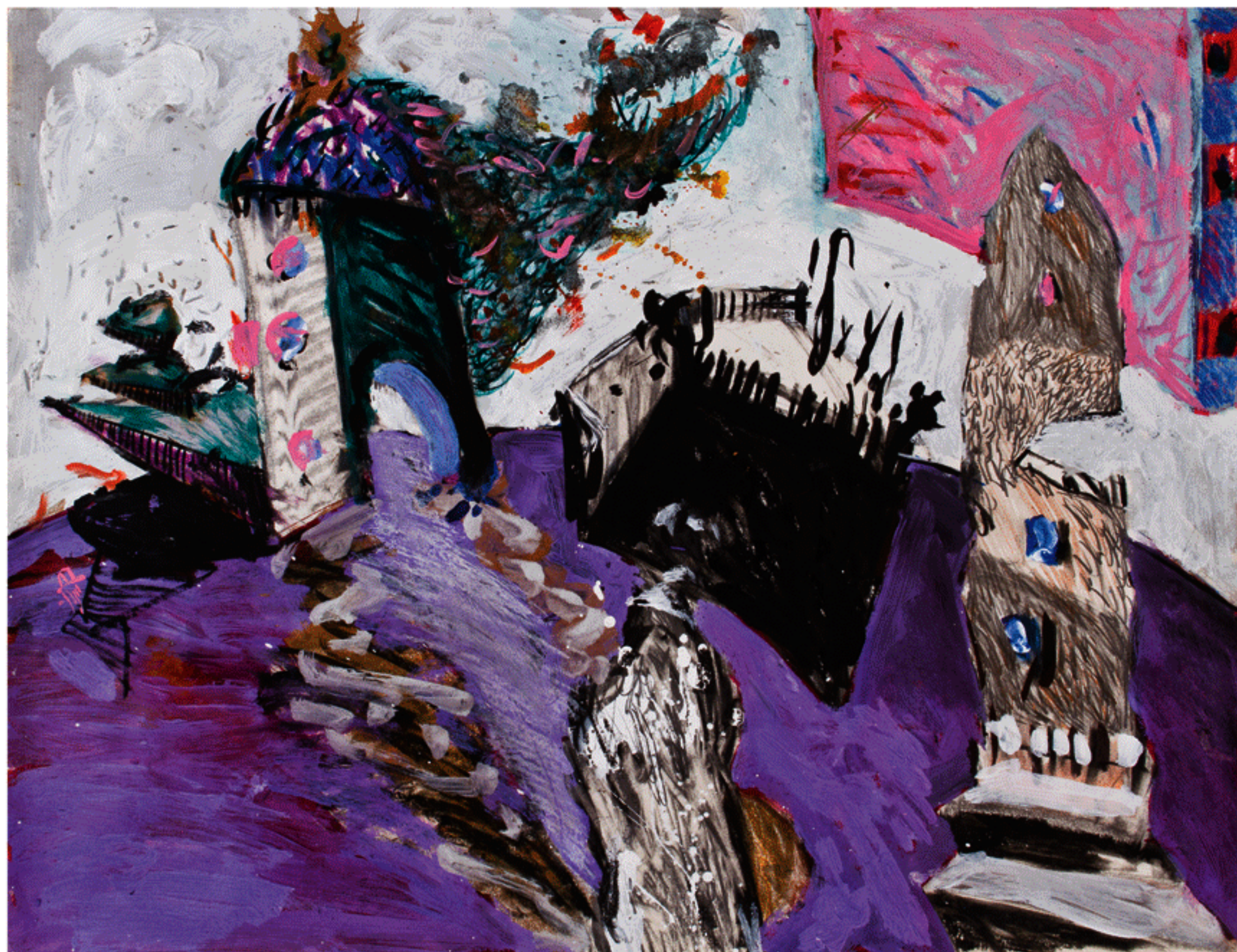
شماره ۱۷ از مجموعه ی شمایل های من، ترکیب مواد روی مقوا، ۵۰×۶۵ سانتی متر، ۱۳۸۶ No. 17 from the My Icons series, mixed media on cardboard, 50x65 cm, 2007