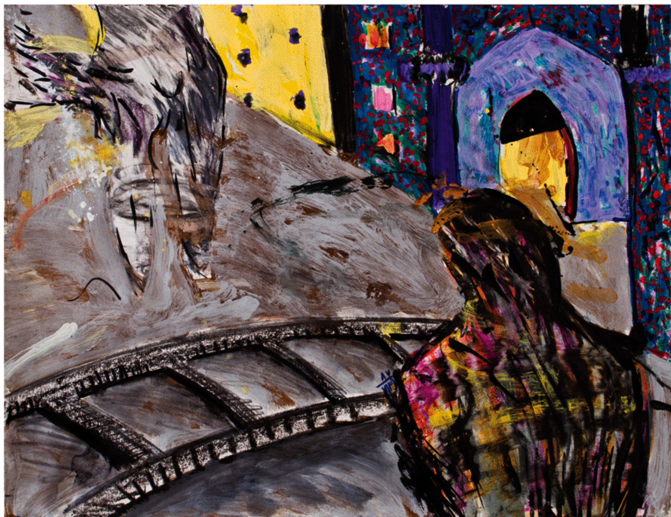
شماره ۱۹ از مجموعه ی شمایل های من، ترکیب مواد روی مقوا، ۵۰×۶۵ سانتی متر، ۱۳۸۷ No. 19 from the My Icons series, mixed media on cardboard, 50x65 cm, 2008