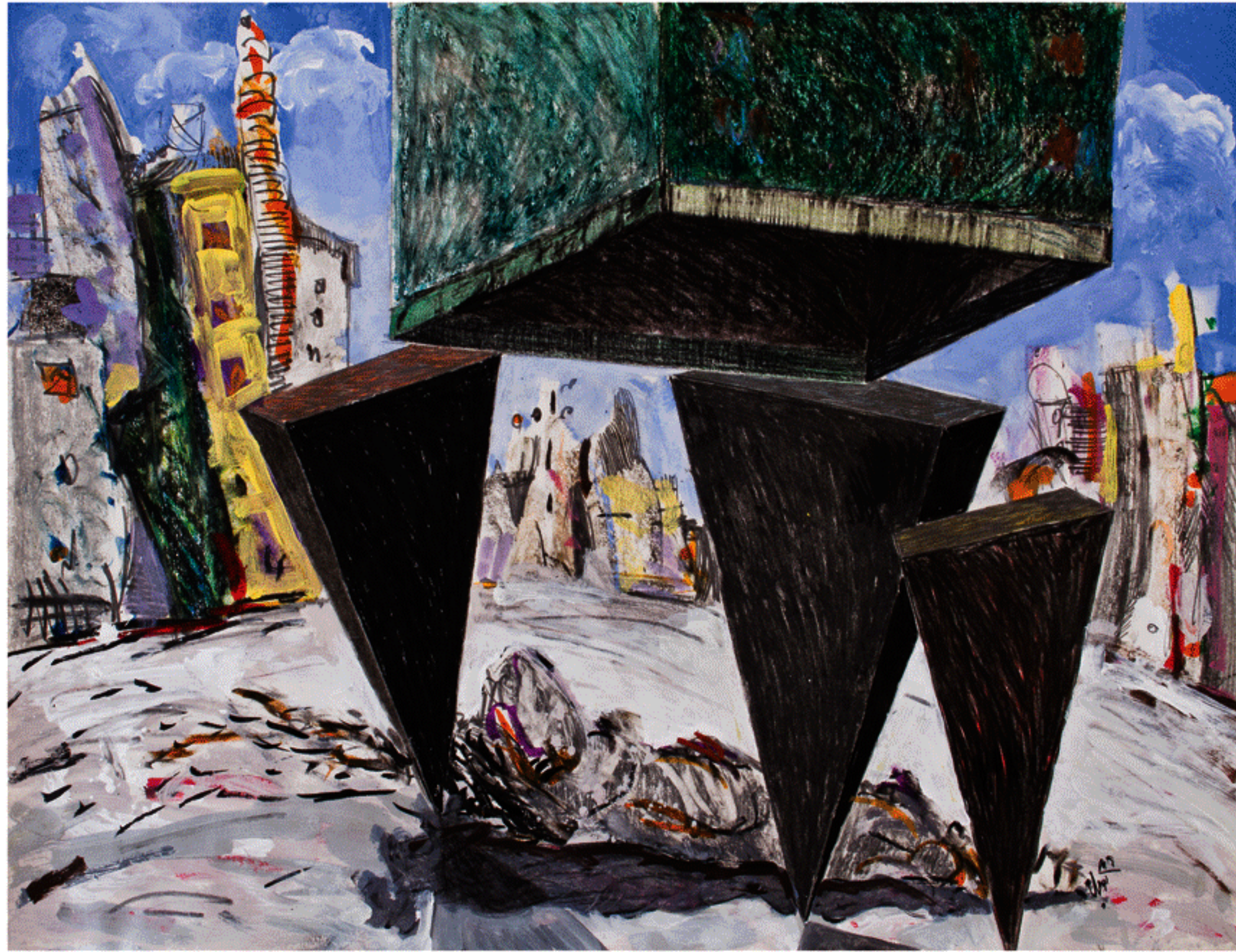
شماره ۱۵ از مجموعه ی شمایل های من، ترکیب مواد روی مقوا، ۵۰×۶۵ سانتی متر، ۱۳۸۶ No. 15 from the My Icons series, mixed media on cardboard, 50x65 cm, 2007