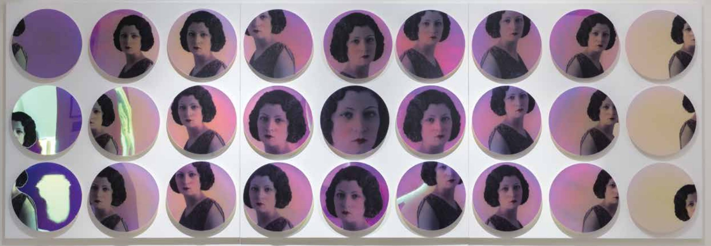
شماره ۱ از مجموعه عبور، چاپ دیجیتال روی پلکسی گلس آینه‌ای، ۳ لته، ۱۰۰×۳۰۰ سانتی‌متر، تک نسخه، ۱۳۹۲ No. 1 from the Traverse series, digital print on acrylic mirror Perspex, triptych, 100x300 cm overall, unique, 2013