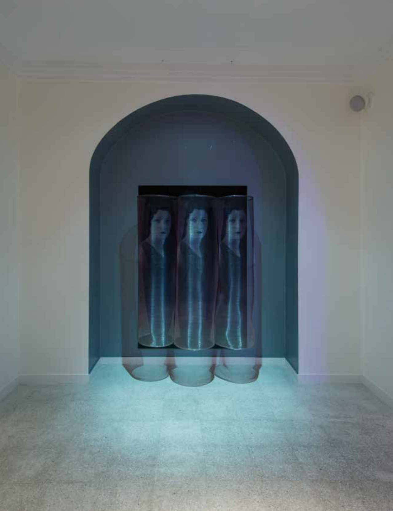
نمای داخلی گالری اثر، زمستان ۱۳۹۲ بازمانده، چاپ دیجیتال روی تورسیمی، پلکسی گلس، ۱۳۹۲ Installation view, Assar Art Gallery, Winter 2014 Remained , digital print on metal net, Perspex, 2013