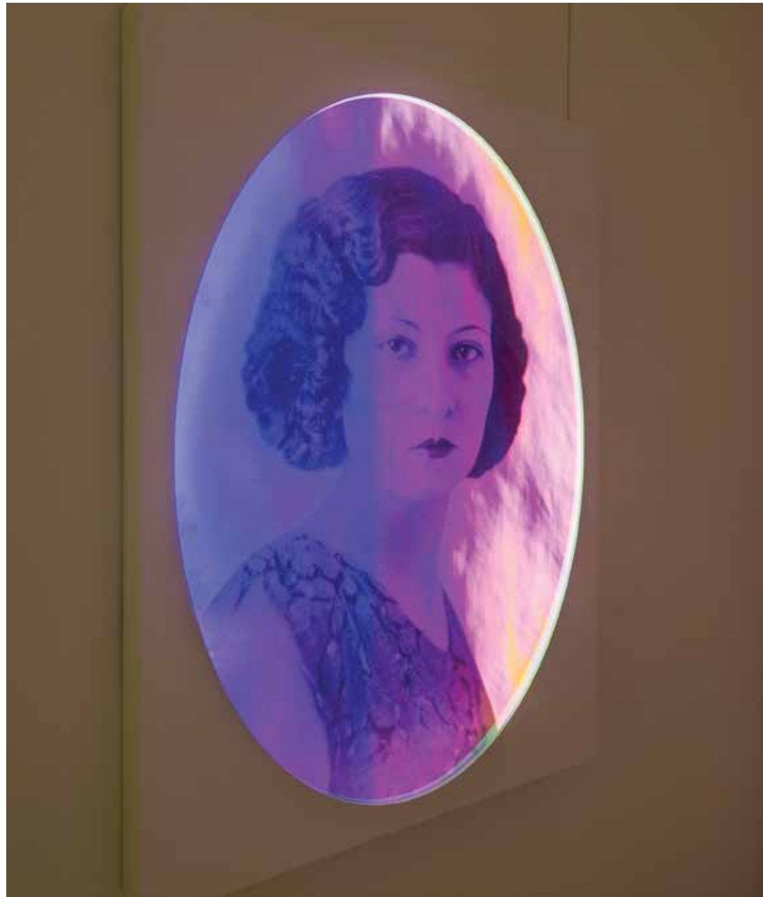
پیدا و پنهان، چاپ دیجیتال روی آینه، پلکسی گلس آینه‌ای - جعبه نور، ۱۴۰×۱۰۰ سانتی‌متر، تک نسخه، ۱۳۹۲ Installation view, Assar Art Gallery, Winter 2014 Visible & Hidden , digital print on mirror, acrylic mirror Perspex - Light box, 140x100 cm, unique, 2013