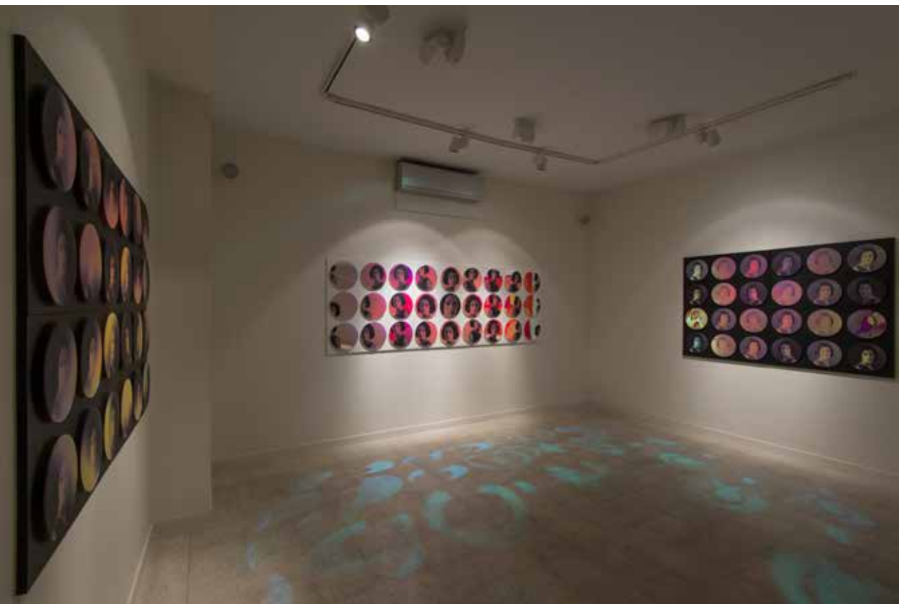
نمای داخلی گالری اثر، زمستان ۱۳۹۲ Installation view, Assar Art Gallery, Winter 2014