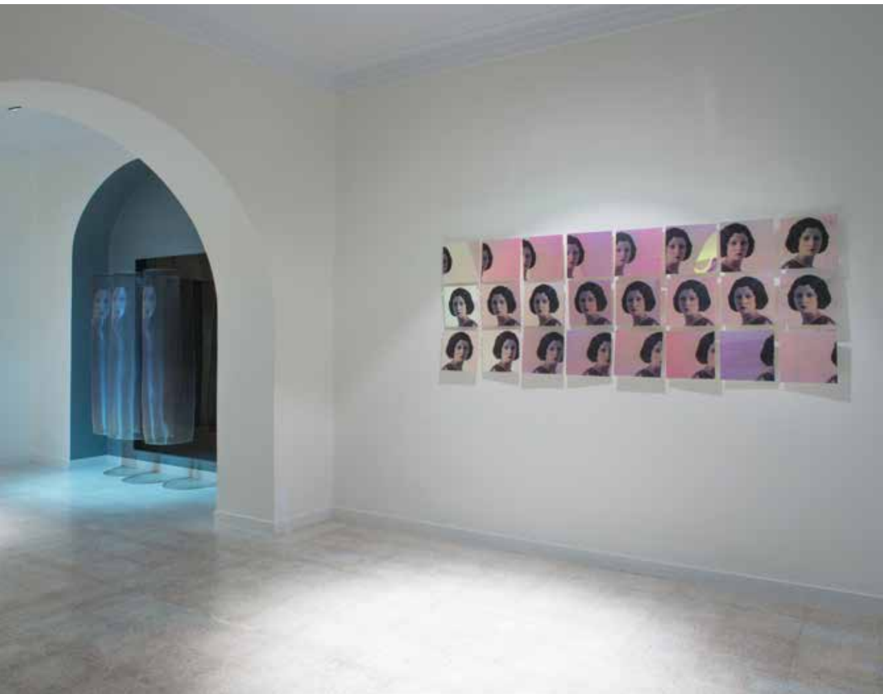
نمای داخلی گالری اثر، زمستان ۱۳۹۲ Installation view, Assar Art Gallery, Winter 2014