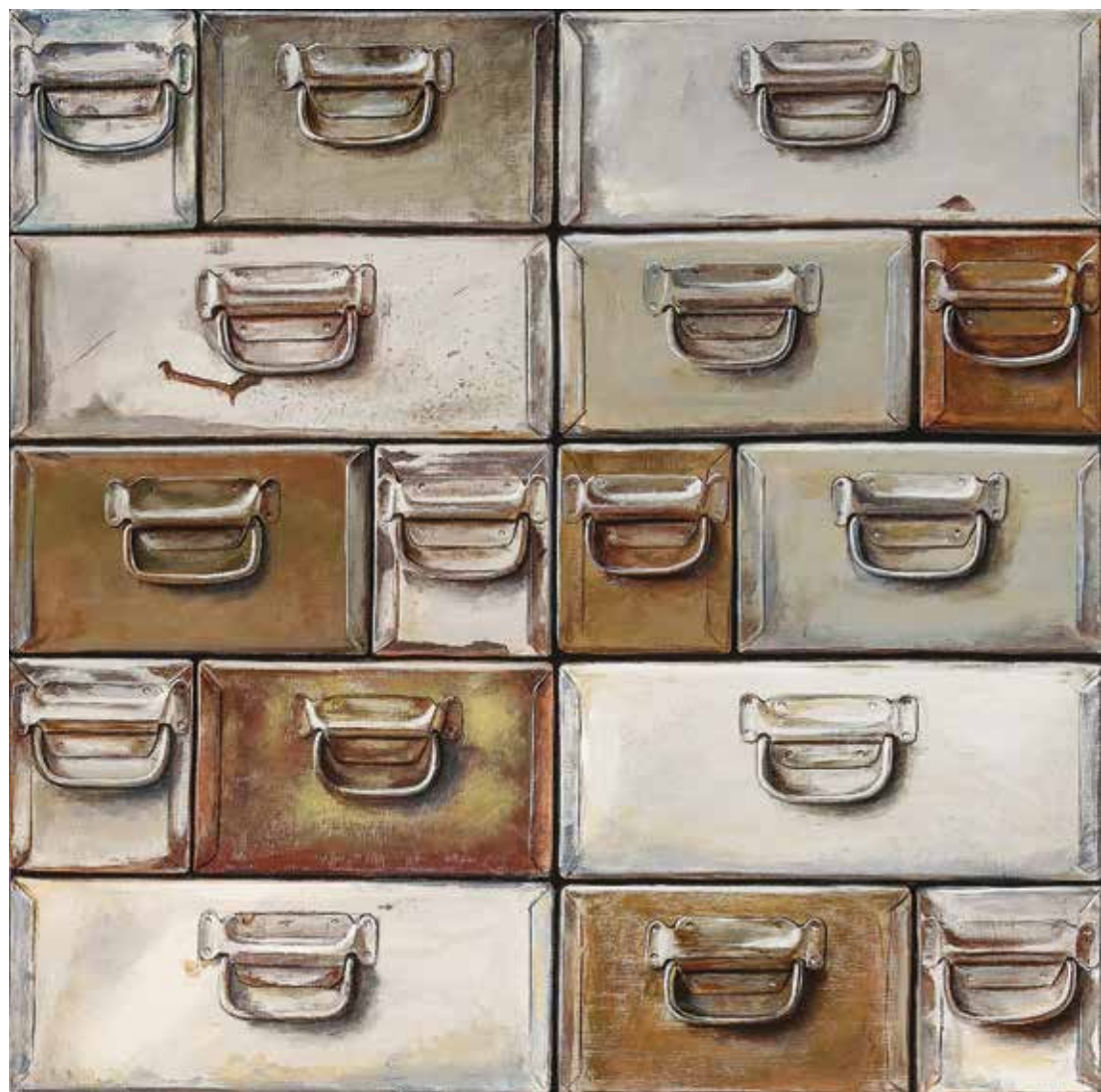
پلاک ۳۵، اکریلیک روی بوم، ۸۰×۸۰ سانتی متر، ۱۳۹۴ No.35, acrylic on canvas, 80x80 cm, 2015