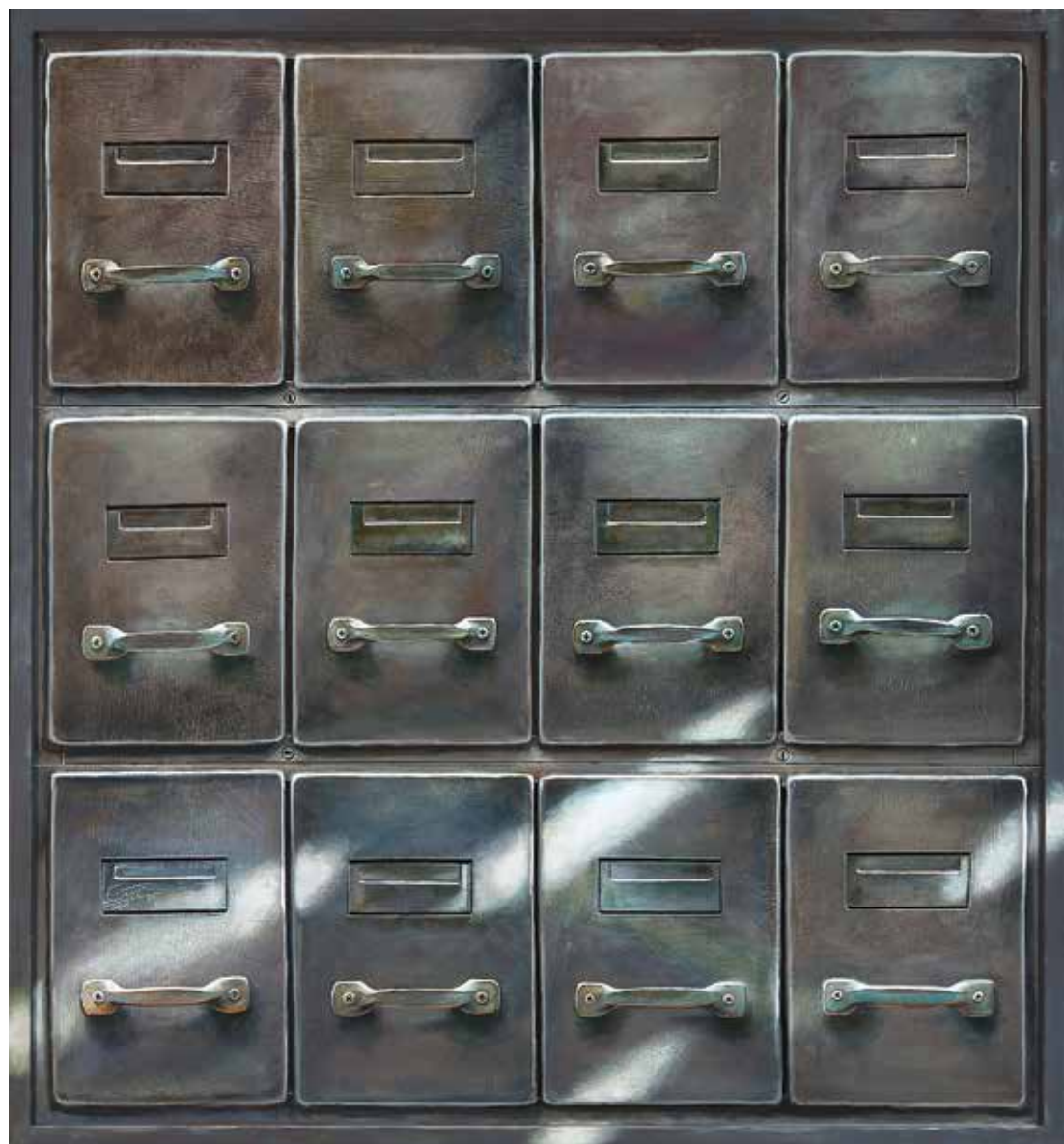
پلاک ۱۸، اکریلیک روی تخته، ۱۰۱×۹۴ سانتی متر، ۱۳۹۴ No.18, acrylic on board, 101x94 cm, 2015