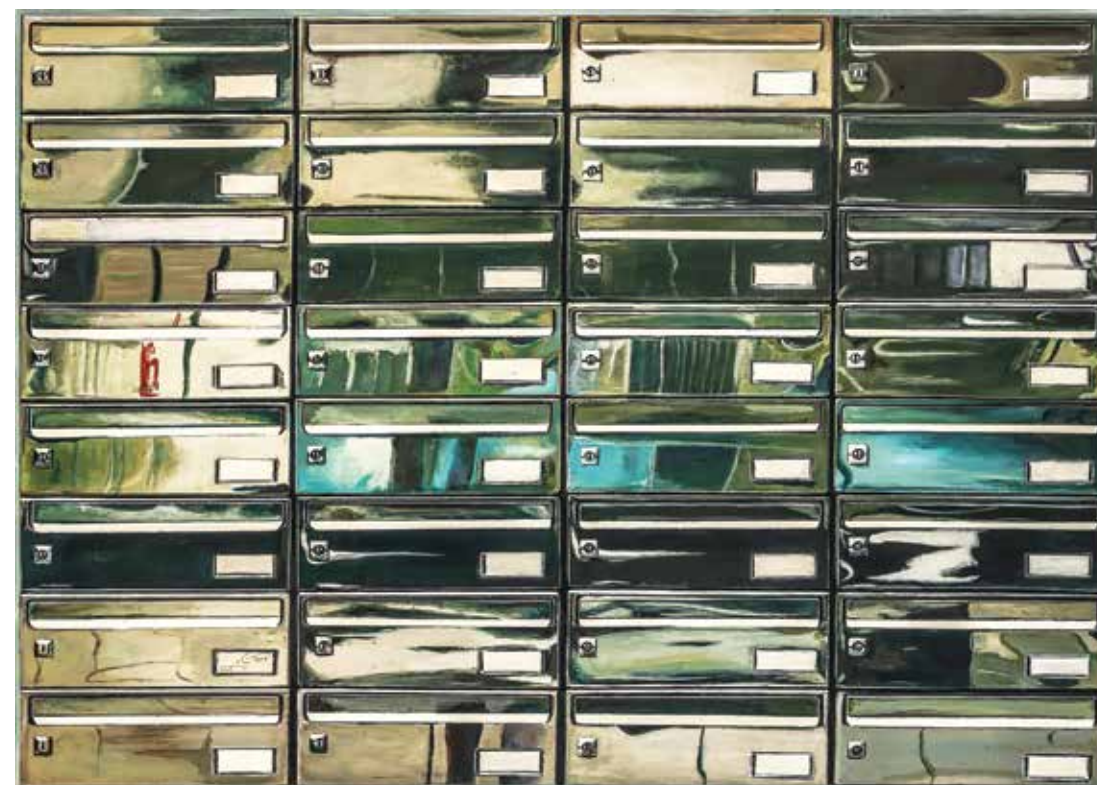
پلاک ۶، اکریلیک روی تخته، ۹۷×۱۳۷ سانتی متر، ۱۳۹۳ No.6, acrylic on board, 97x137 cm, 2015