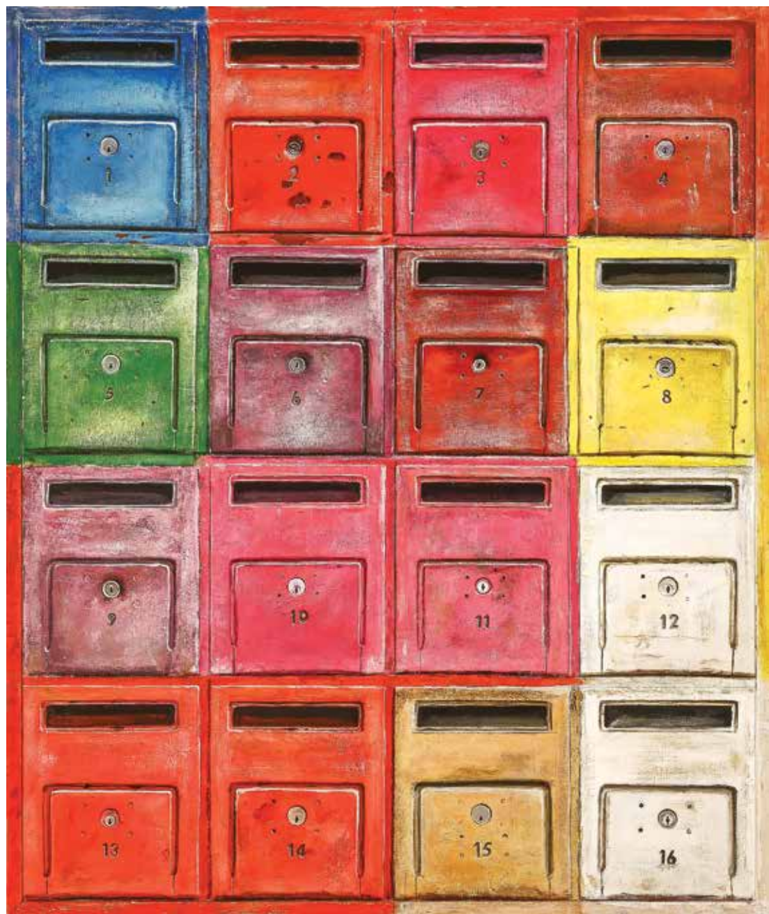
پلاک ۱.۴ اکریلیک روی تخته، ۱۰۳×۱۲۳ سانتی متر، ۱۳۹۴ No.4, acrylic on board, 123x103 cm, 2015