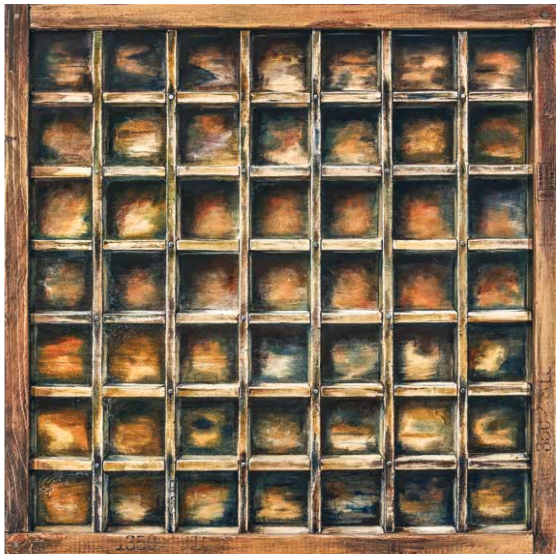
پلاک ۱، اکریلیک روی چوب، ۸۶×۸۶ سانتی متر، ۱۳۹۳ No. 1, acrylic on wood, 86x86 cm, 2015