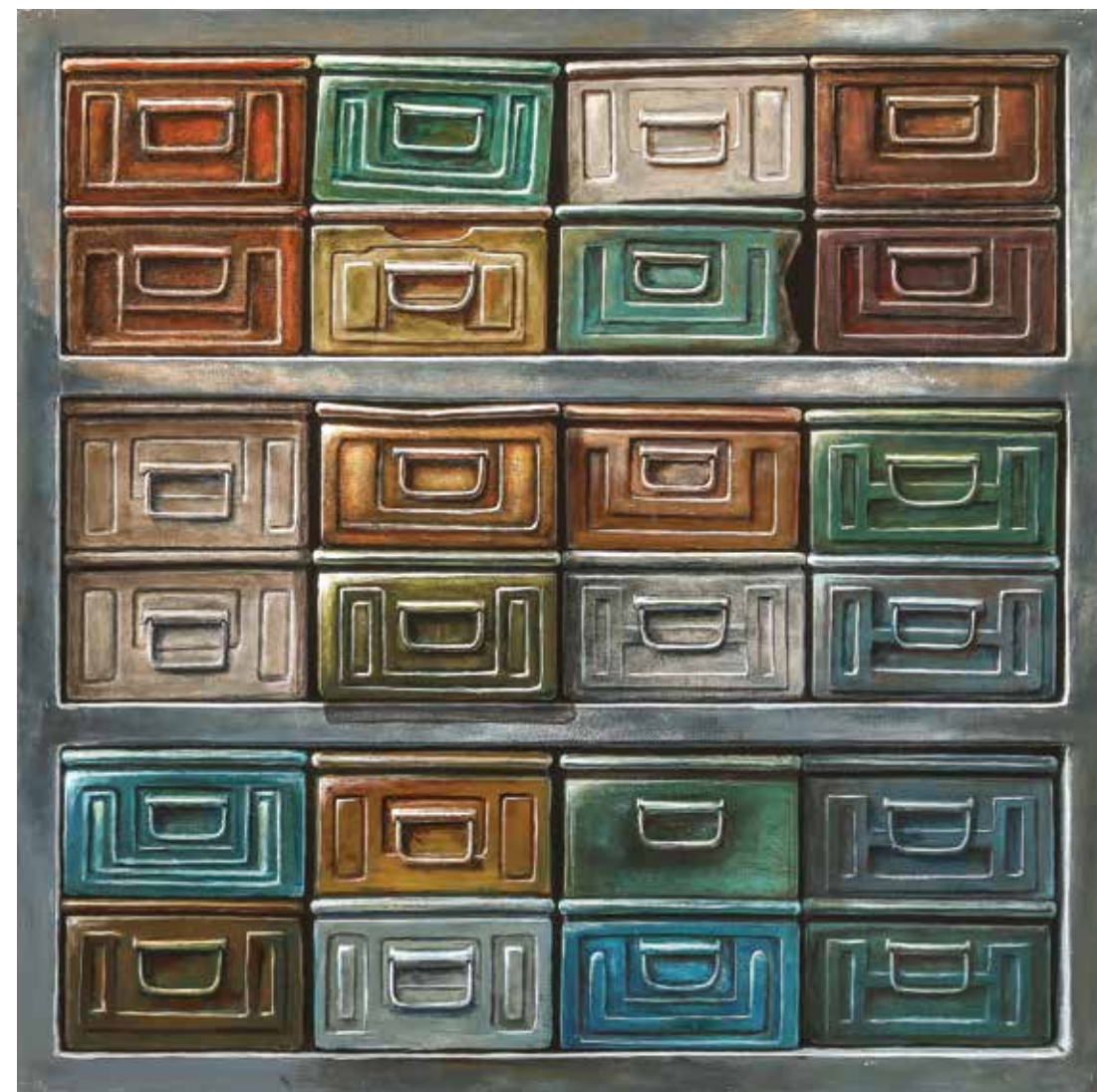
پلاک ۴۰، اکریلیک روی تخته، ۱۰۰×۱۰۰ سانتی متر، ۱۳۹۴ No.40, acrylic on board, 100x100 cm, 2015