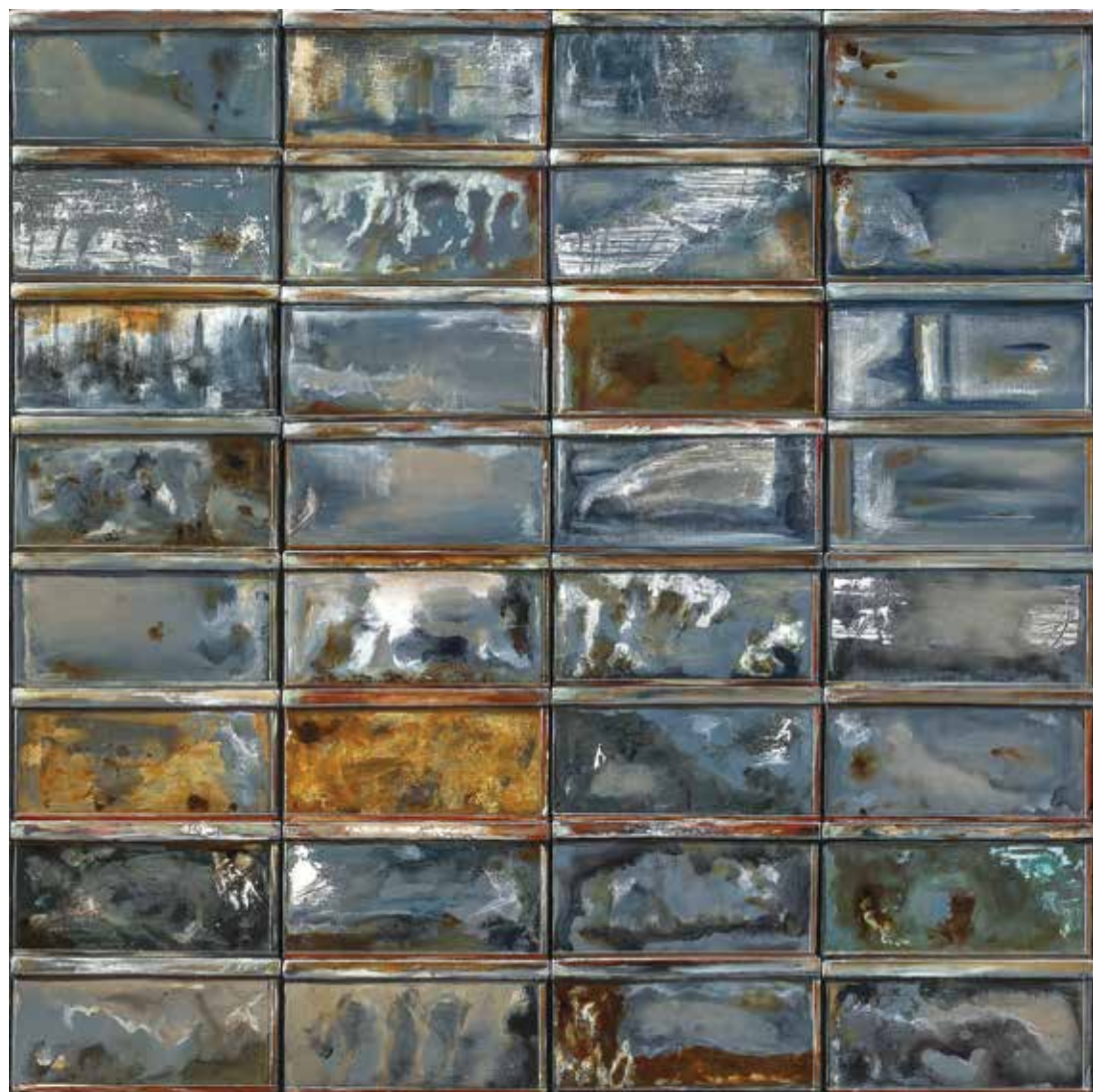
پلاک ۳۹، اکریلیک روی بوم، ۱۰۰×۱۰۰ سانتی متر، ۱۳۹۴ No.39, acrylic on canvas, 100x100 cm, 2015