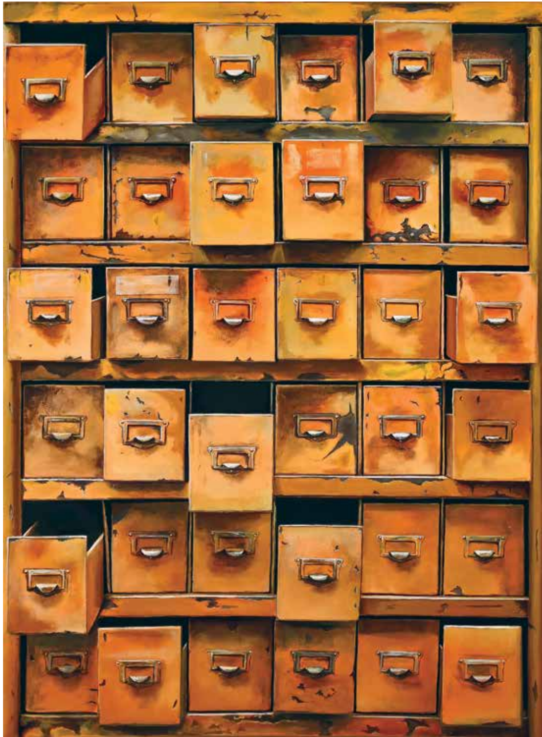
پلاک ۲۱، اکریلیک روی بوم، ۱۰۰×۱۳۶ سانتی متر، ۱۳۹۴ No.21, acrylic on canvas, 136x100 cm, 2015