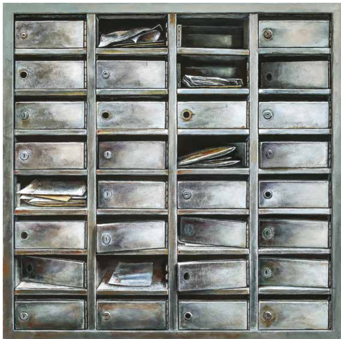
پلاک ۷، اکریلیک روی تخته، ۱۱۱×۱۱۱ سانتی متر، ۱۳۹۴ No.7, acrylic on board, 111x111 cm, 2015