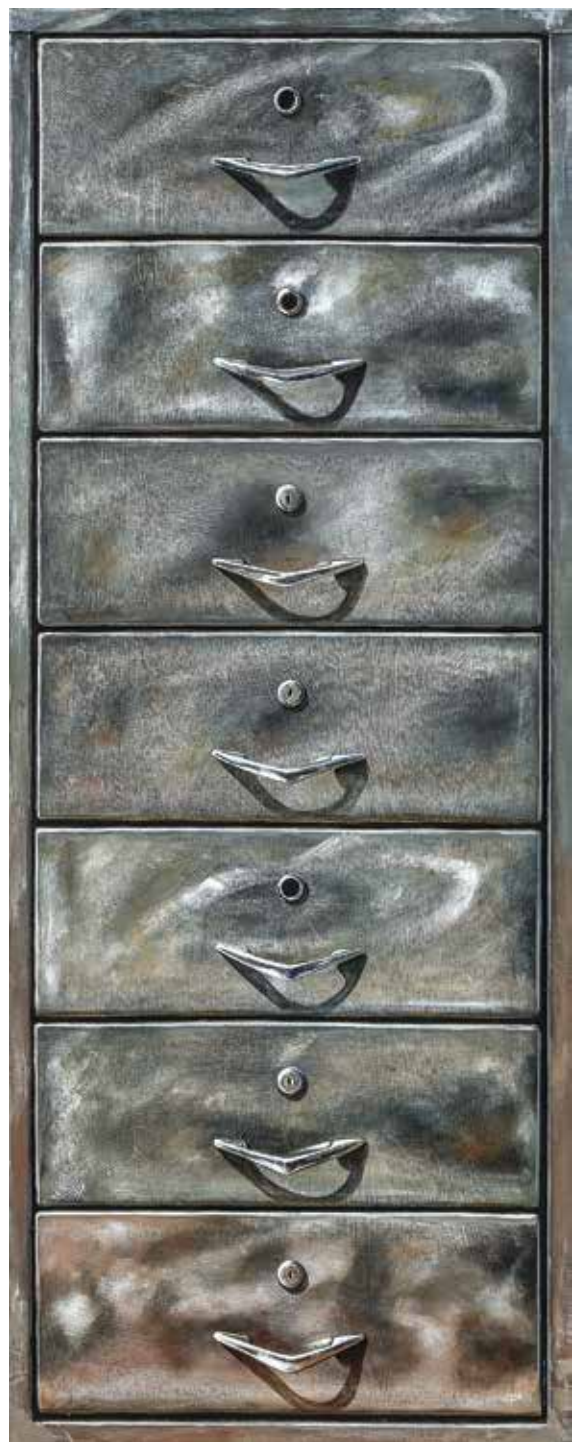
پلاک ۱۳، اکریلیک روی تخته، ۱۵۳×۶۰ سانتی متر، ۱۳۹۴ No.13, acrylic on board, 153x60 cm, 2015