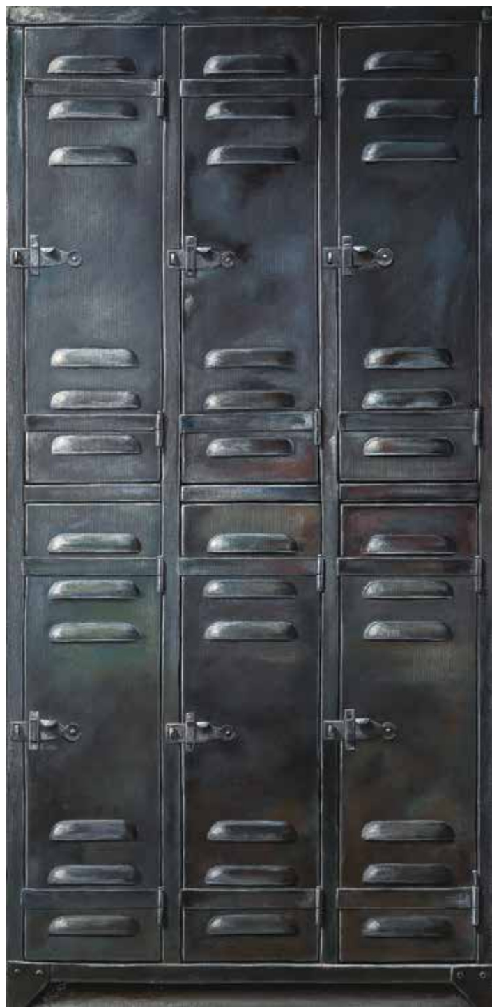
پلاک ۴۹، اکریلیک روی بوم، ۱۸۶×۹۰ سانتی متر، ۱۳۹۴ No.49, acrylic on canvas, 186x90 cm, 2015