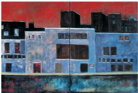
46066 atrium, 1991, oil on canvas, 100 x 100 cm