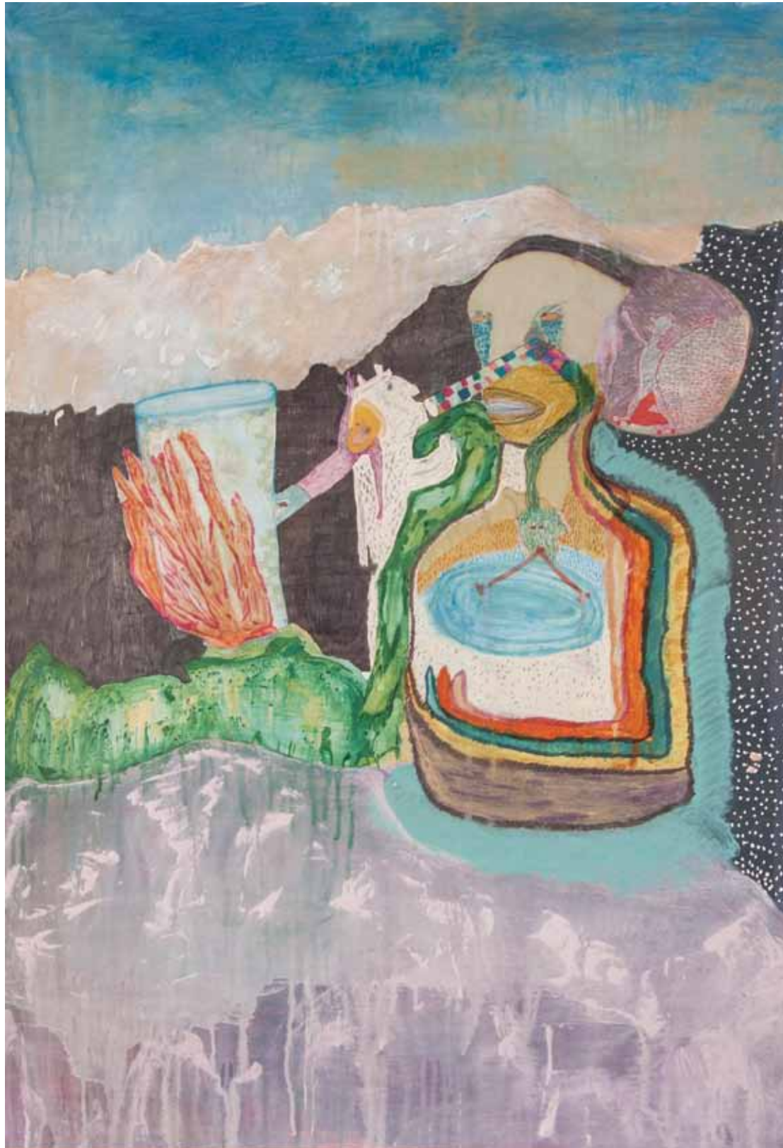
«بدون عنوان»، اکریلیک، جوهر و ماژیک روی کاغذ، ۱۰۰x۷۰ سانتی متر، ۱۳۹۲