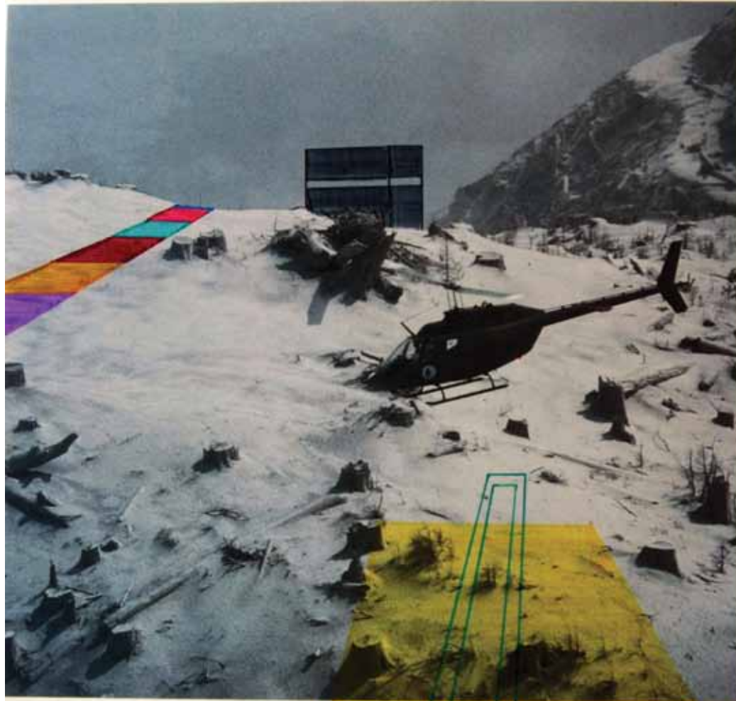
Washington 1980 RALPH PERRY

In the erupstion wasteland, this truck yielded two victims to searchers ten miles from Mount St. Helens. Photos of the destruction by 21 photographers appeared in the January 1980 magazine.