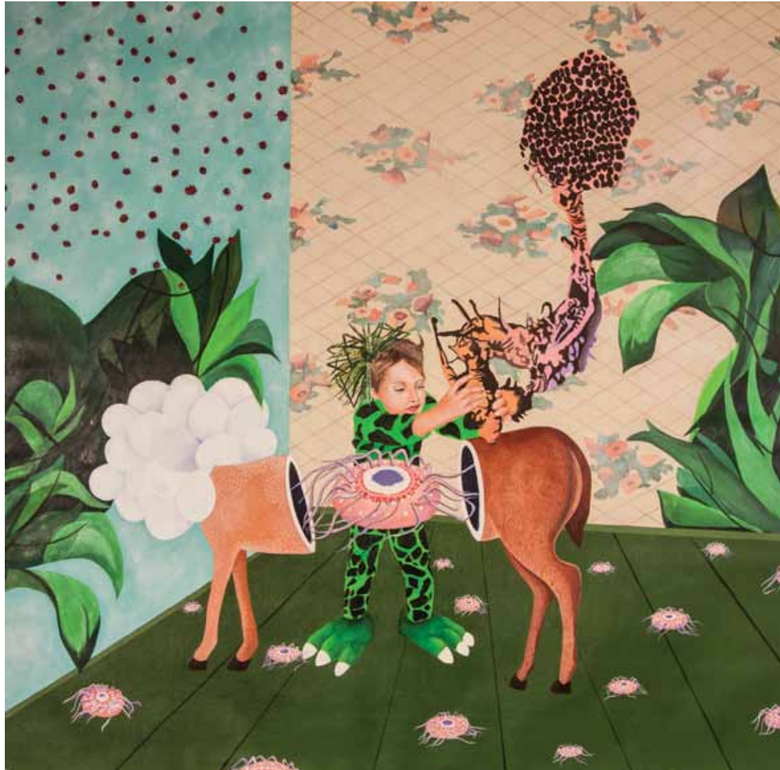
«خالق»، اکریلیک روی بوم، ۱۲۰x۱۲۰ سانتی متر، ۱۳۹۳ Demiurge, acrylic on canvas, 120x120 cm, 2014